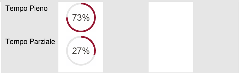
Distribuzione per Qualifica (Dati in percentuale rilevati al 31/03/2025)